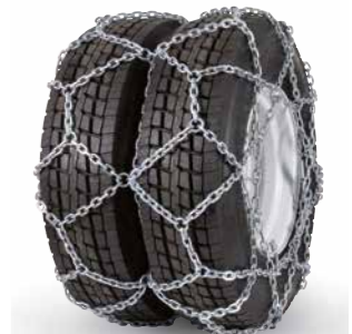
pewag austro super reinforced twin