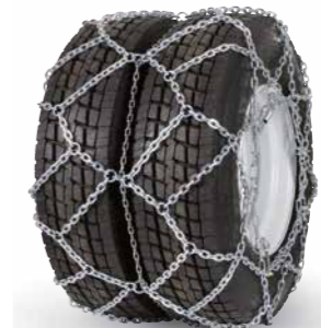
pewag austro super twin